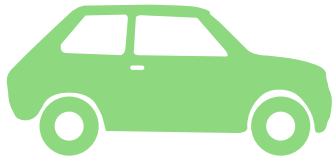
grüne Autos / Vans