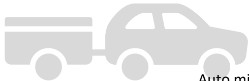
Auto mit Anhänger